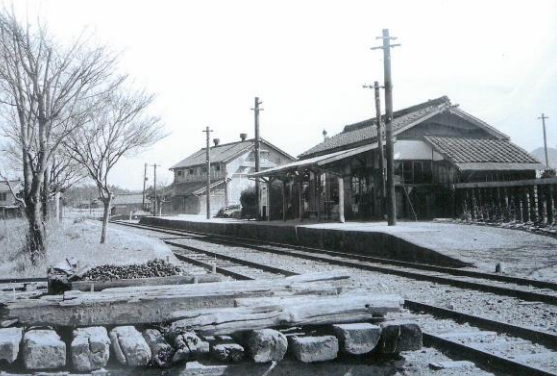
北条線法華口駅 (昭和32年頃)