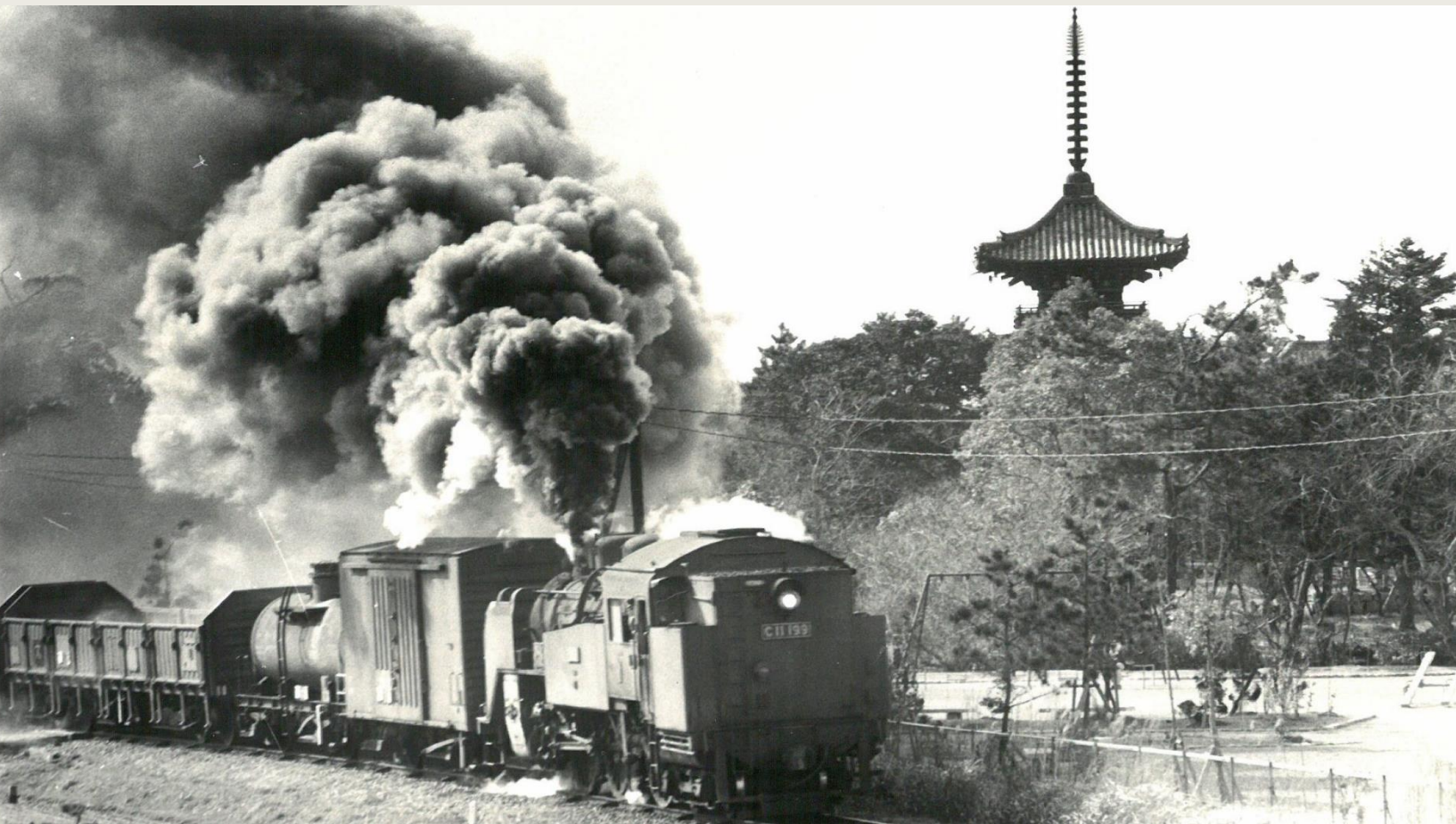
旧国鉄高砂線 (昭和30年頃)