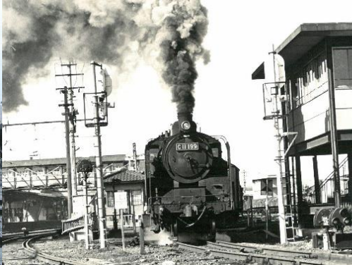
旧国鉄加古川駅を発車するC11形蒸気機関車 (昭和40年頃)