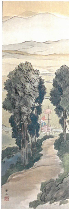
三木翠山 「炎天蟬聲図」