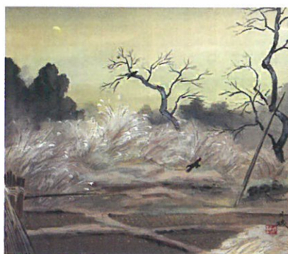
森月城「秋村新月図」