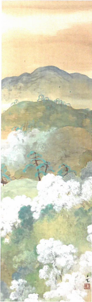
森月城「吉野山(仮題)」