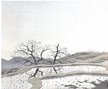
奥村厚一「棚田の月(仮題)」