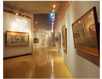
(1階)展示室 2 変わった形の展示室ですが、照明で作 品を素敵に演出します。 床面積は約 64 m 2 です。