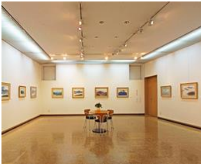
(1階)展示室 1 グループ展や個展で利用されています。 床面積は約 76 m 2 です。